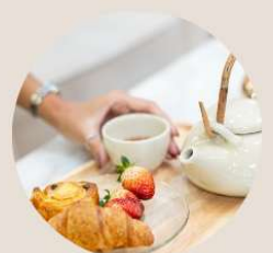
Tea & Coffee